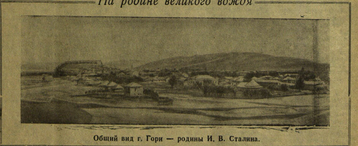
Общий вид г. Гори — родины И. В. Сталина.